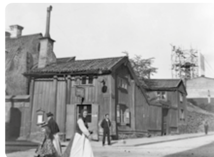
Folkliv vid hörnet Götgatan/Folkungagatan, 1890. Upphov: Kasper Salin, Stockholms stadsmuseum. Hämtad från Digitala stadsmuseet, id nr: SSMF004511