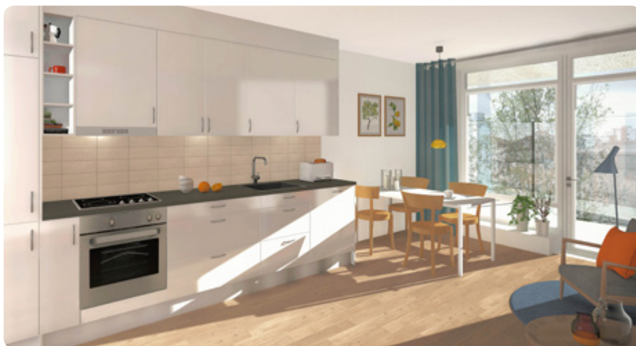
Illustration: Eriksson & Runskö Arkitekter

Just nu pågår ett spännande projekt i vår fastighet på Tranebergsvägen 45 i Alvik. Tidigare gemensamhetsutrymmen byggs om till tolv seniorbostäder. Lägenheterna utformas som 1–2 rum och kök och i huset finns ett allrum där grannar kan mötas och umgås.