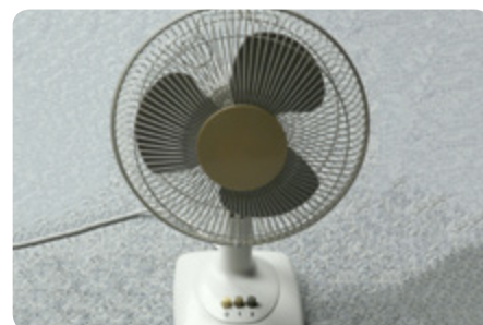
Skönt med bordsfläkt hemma.

används för att cirkulera luften i rummet).