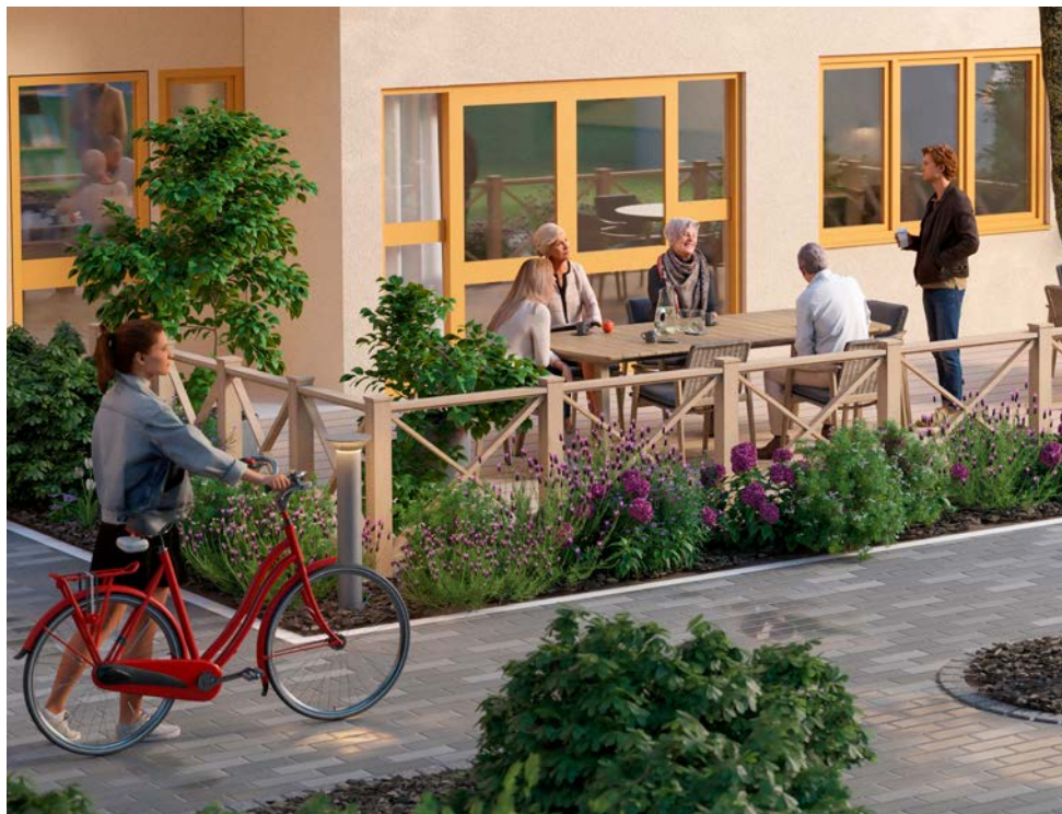
Visionsbild av Kista seniorbostäder av PE Teknik & Arkitektur.