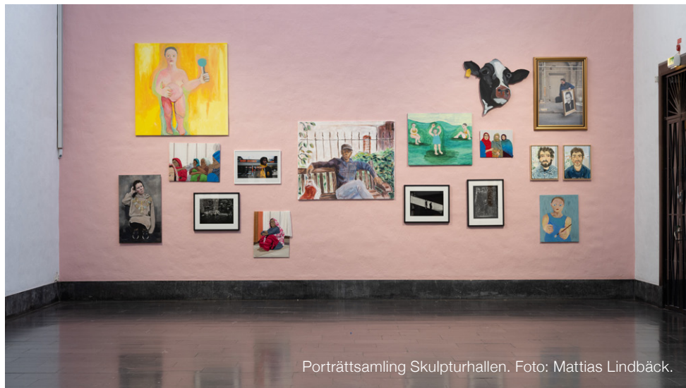
Porträttsamling Skulpturhallen.