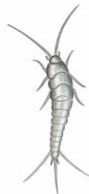
Silverfisk (Lepisma saccharina)

Silverfisken är allätare och lever bland annat av de rester som samlas i golvbrunnar och avloppsrör. Favoritfödan är saker som innehåller stärkelse; klister, bokbindningar, socker, hår och mjäll. Den kan ibland göra skada på äldre bokband, papper och stärkta tyger. Men även bomull, silke eller döda insekter duger som föda. Silverfisken kan till och med äta sitt eget ömsade skinn. Den kan också svälta i flera månader utan att ta skada. Normalt gör silverfisken inte någon skada utan kan betraktas som en nattlig renhållningsarbetare.